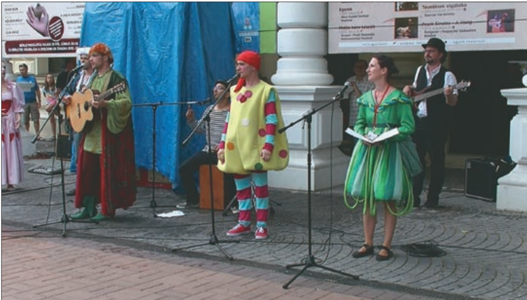
A belváros pár napra idén is meseországgyá változik majd

Egy hónap múlva, június 21-e és 24-e között elfoglalják a várost a bábok. Ekkor rendezi meg ugyanis a Békéscsabai Napsugár Bábszínház a XVII. Nemzetközi Bábfesztivált, mely az ország egyik legjelentősebb bábos találkozója.