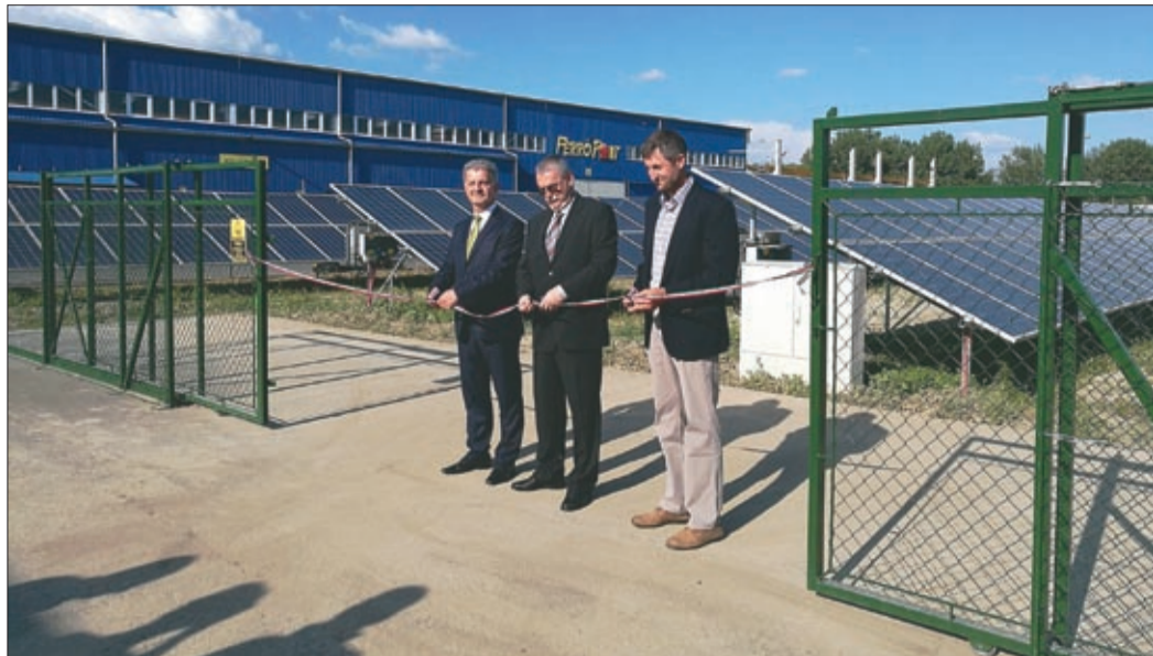
A napsütéses órák száma Békéscsabán évi 2200 óra, ezt mostantól hasznosítják is