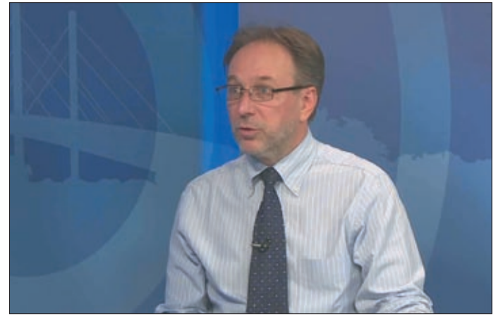
Békéscsabán több mint húsz előadást, gálát rendezett

A Békéscsabán eltöltött nyolc igazgatói év alatt létrehozta és beindította a Szarvasi Vízi Színházat, megépítette a Jókai Porondszínházat, Közép-Európa kiemelkedő cirkusz-színházi mobil színterét, létrehozta a Magyar Teátrum Díjat, mellyel évente az előadó-művészeti háttérszakmák legkiválóbb képviselőit jutalmazták. Ellátta a Vidéki Színházak Szövetségének elnöki tisztét, felelős kiadója volt a Bárka irodalmi folyó-