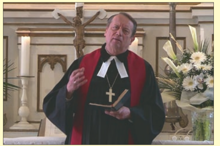
Ha az Úristen valamit lezár, máshol új kaput nyit

– Egyházkerületünkben nagy alföldi megyék is vannak, így jött az a gondolat, hogy a kalász, mint egy nagyon komoly bibliai szimbólum, jelenjen meg valahol. Ebben benne van a jézusi hitvallás: a magnak földbe kell esnie ahhoz, hogy aztán termést hozzon. Kiadtuk a feladatot a békéscsabai művészeti tagozatos diákoknak, hogy próbáljanak megálmodni egy olyan logót, ami ezt kifejezi. Azóta ez a logó is hirdeti azt a reménységünket, hogy noha bizonyos helyeken kiszáradnak a fák, ugyanakkor mindig vannak új hajtások és szárba szökkenő kalászkok. Mindent meg kell tennünk, amit mi tudunk,