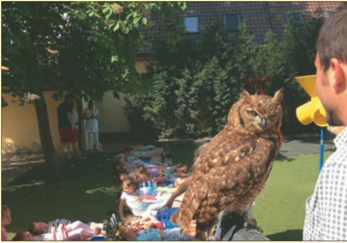
Egy bagollyal is megismerkedhettek az ovisok

A Kölcsey utcai óvodában már hagyománynak számít a Játékvárzás program, amelynek keretében a gyerekek játékos formában ismerkedhetnek meg a természetben élő állatokkal. A sorozat újabb állomásán a madarak és fák napját ünnepelték; az óvodások madárbemutatót, faültetésen és egy ismeretterjesztő foglalkozáson is részt vehettek.