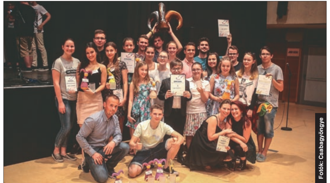
A csabai színistúdiósok méltán lehetnek büszkéek az eredményeikre

Számos díjjal és arany minősítéssel zárta a Csabai Színistúdió az idei Scherzót. A huszonkettedik Amatőr Musical Színpadok Fesztiválján kilenc társulat között szerepeltek eredményesen a békéscsabaiak. A megmérettetésre Békéscsaba mellett Budapestről, Gödöllőről, Kalocsáról, Miskolcra és Vácról is érkeztek csoportok.