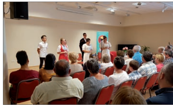
A nagyszalontai gyerekek érzelmdús versekkel készültek

A ferences rendi szerzetes az előadásában beszélt a család fontosságáról, a férfi-nő kapcsolatáról és a gyermekekről is, hisz minden egyes gyermek egy csoda, s „ha ajtót nyitunk előttük, esélyt adunk nekik, hogy kibontakoztassák a személyiségüket, a tehetségüket. Nem kell hozzá mást tenni, csak egymásból a jót kiszerezni”.