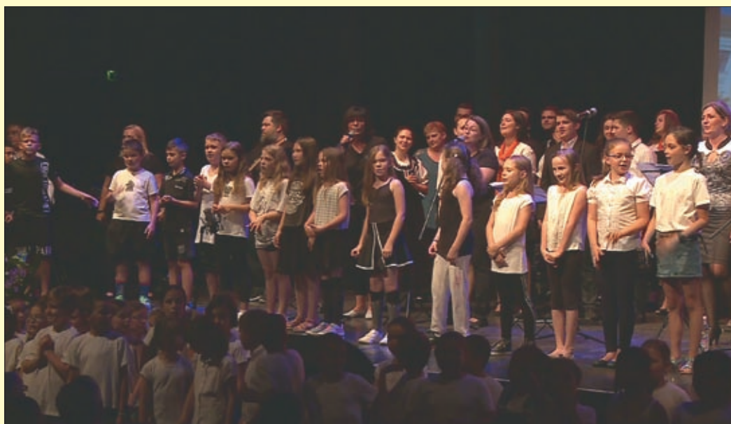
A Csabagyöngyében az egykori és a mai diákok gálán adták hálát az elmúlt 25 évért

Újraindítása óta eltelt negyedszázados évfordulóját ünnepelte a Zseberényi Gusztáv Adolf Evangélikus Gimnázium. Június 2-án, a Csabagyöngyében az iskola egykori és jelenlegi diákjai, tanárai gálaműsorral adták hálát az elmúlt 25 év küzdelmeiért és sikereiért.