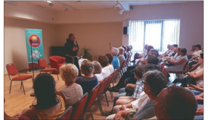
Böjte Csaba előadása magával ragadta a közönséget

Békéscsabán tartott előadást Böjte Csaba ferences rendi szerzetes június 7-én. A Dévai Szent Ferenc Alapítvány alapítója a családok szerepéről és fontosságáról beszélt a Csabagyöngye Kulturális Központban.