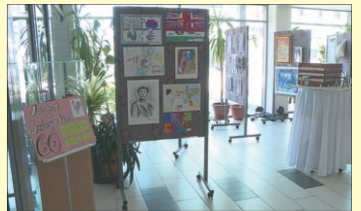
A művésztanárok és a diákok alkotásaiból nyílt kiállítás