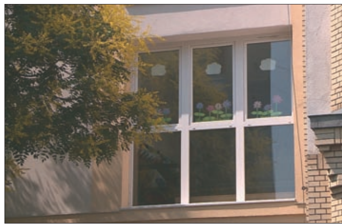
Mindenütt megtörtént a nyílászárók cseréje, korszerűsítése

biakban: Rendelet). A Rendelet megtekinthető a www.bekescsaba.hu honlapon, továbbá Békéscsaba Megyei Jogú Város Polgármesteri Hivatal Szociálpolitikai Osztályán (5600 Békéscsaba, Szabadság tér 11–17.).