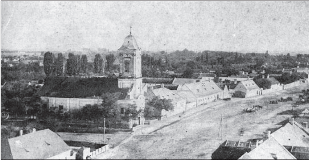
Csaba látképe 1820-ban, amikor már felépült a tornyos katolikus templom

Így élt Csaba népe az újraterelítés 100. évfordulóján