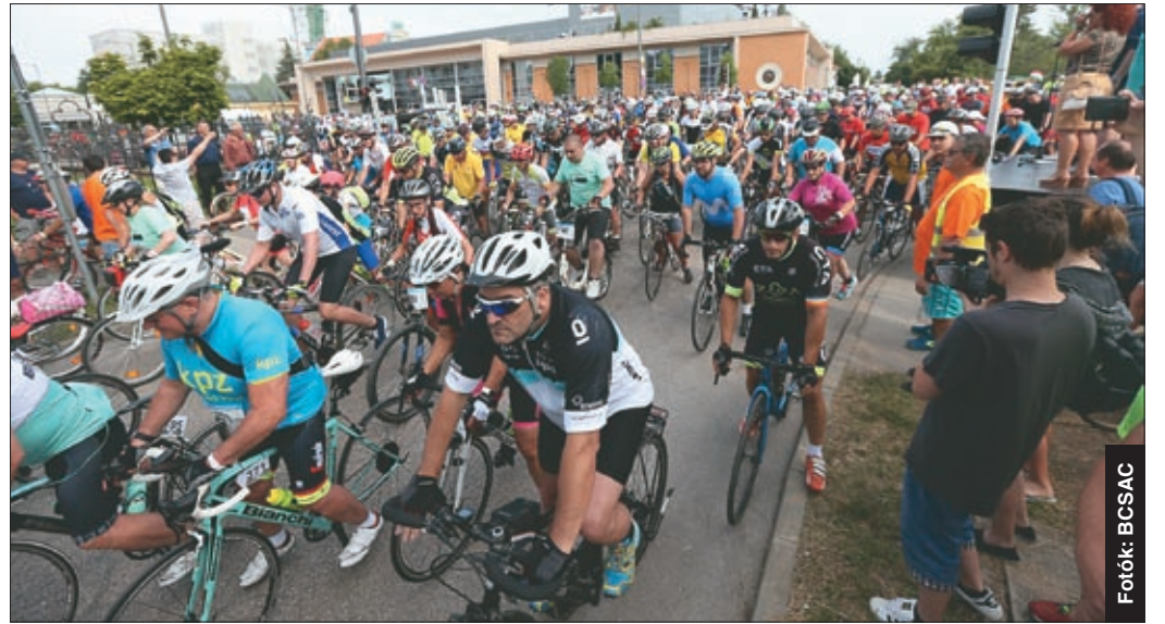
Kétszer száz kilométeres távnak a legtöbben kerékpáron vágta neki

A versenyzők Újkígyóson, Medgyesegyházán, Mezőkovácsházán és