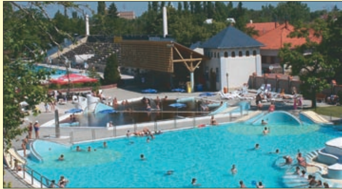
Este kilenc óráig várják a strandolni vágyókat

Bár már április vége óta a nyári menetrend szerint várja vendégeit Békéscsabán az Árpád Gyógy-és Strandfürdő, az igazi nagyüzem most, a vakáció kezdetétől indul be: az iskolai szünetben hosszított nyitva tartással, minden nap 21 óráig állnak a pancsolni, strandolni, úszni vágyók rendelkezésére.