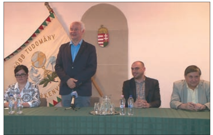
Projektzáró az Andrassy Gyula Gimnázium és Kollégiumban

– Az egészségháztól a kerékpárutakig számos