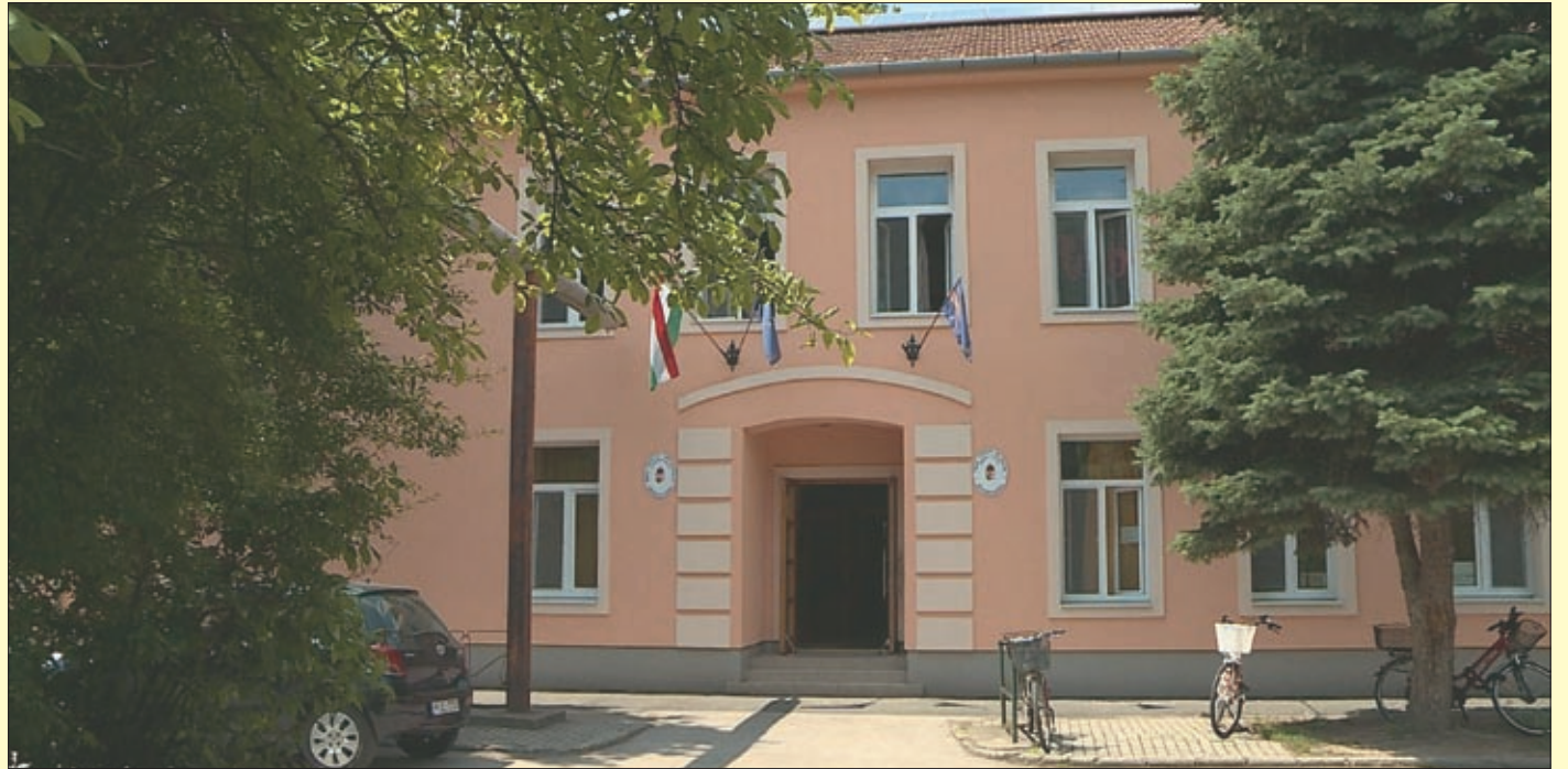
Az idén hatvanéves Jankay iskola épületében időszerű volt a felújítás

Békéscsaba önkormányzata uniós forrásból pályázott és nyert a Terület és Településfejlesztési Operatív Programban négy iskola energetikai felújítására, közel 680 millió forint értékben. Ebből a Jankay iskola fejlesztésre több mint 132 millió forintot, az Andrásy gimnázium kollégiumára 206 millió forintot, a Petőfi utcai iskola korszerűsítésére mintegy 179 millió forintot, az Erzsébethelyi iskola Madách utcai épületére 160 millió forintot fordítottak. A beruházás mind a négy intézményben befejeződött, a hivatalos átadót még