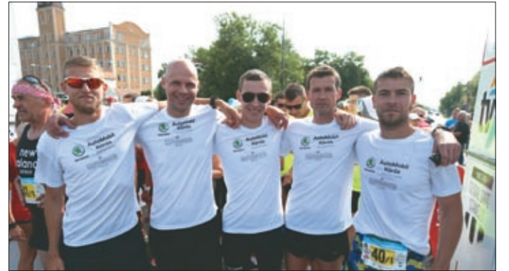
A győztes férfi váltó: a ŠKODA Automobil Körös