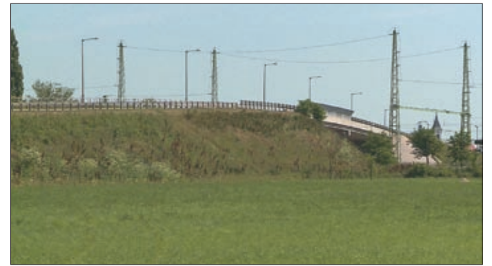
A vasút melletti ipari park 192 millió forintból épülhet meg

A fejlesztések célja, hogy helyben tartásuk a lakosság, valamint új munkahelyeket teremtsen biztosítsanak megélhetési lehetőséget