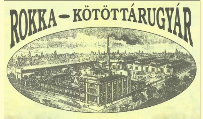
A Rokka épületének látványa az induláskor