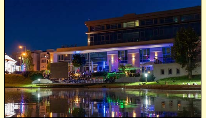
A stégen mozi és koncertek is várják a nézőket

igazgató kiemelte, nagy öröm, hogy három hónap kihagyást követően újra élet költözött a könyvtárba, és korlátozott szolgáltatásokkal újranyithattak. A mostani első kiállításon egyébként a nyomdaipari csomagolóanyagok kaptak más funkciót a BSZC Szent-Györgyi Albert szakgimnáziuma művészeti tagozatosainak jóvoltából.