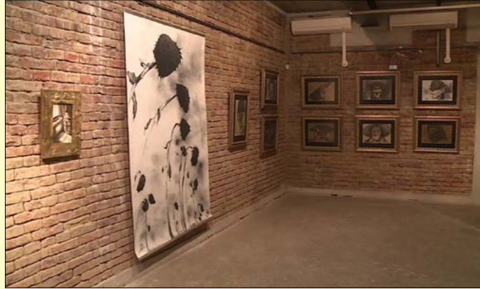
Újra látogathatók a múzeum kiállításai

A járvány miatt hozott jogszabályok enyhítésének köszönhetően június 18-a után megnyithattak a kulturális intézmények közösségi terei. A Csabagyöngye Kulturális Központ már az új szabályozás megjelenését követő reggelen kitarja kapuit, majd a Békés Megyei Könyvtár, a Békéscsabai Jókai Színház és a Munkácsy Mihály Múzeum is élt ezzel a lehetőséggel.