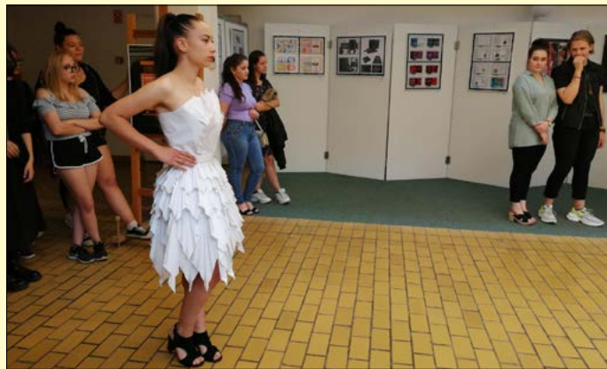
Rendhagyó kiállítás-megnyitó a könyvtárban