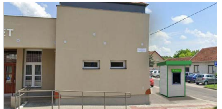
Az ATM az egészségház mellett lesz (látványterv)