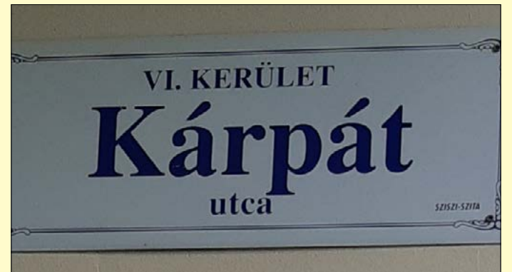
Számos utca őrzi az elcsatolt területek nevét

Egy olyan személyről (Lord Rothermere) is neveztek el közterületet Békéscsabán, aki egy magyarországi látogatás után Angliában, egy napi 1 millió példányban megjelenő újságjában hívta fel a figyelmet a trianoni béke igazságtalanságára. A Rothermere utca ma Batsányi utca.