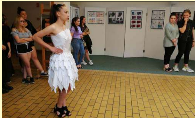
Rendhagyó kiállítás-megnyitó a könyvtárban