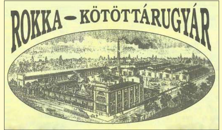
A Rokka épületének látkepe az induláskor