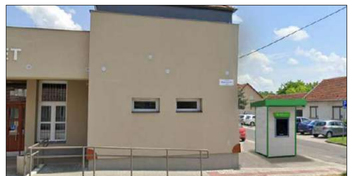
Az ATM az egészségház mellett lesz (látványterv)