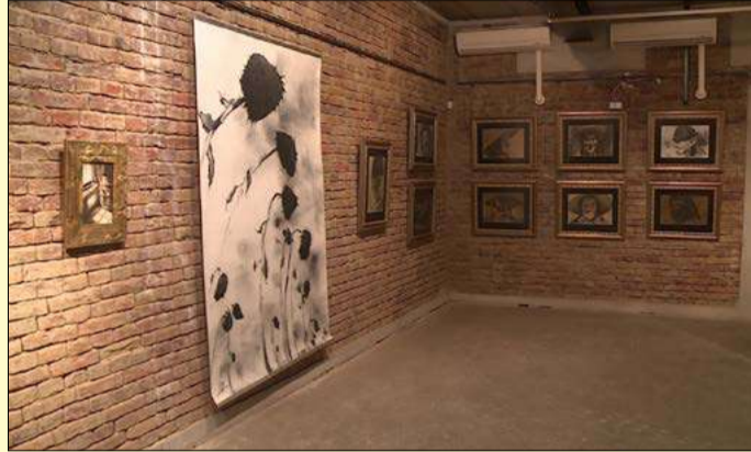
Újra látogathatók a múzeum kiállításai

A járvány miatt hozott jogszabályok enyhítésének köszönhetően június 18-a után megnyithattak a kulturális intézmények közösségi terei. A Csabagyöngye Kulturális Központ már az új szabályozás megjelenését követő reggelen kitarja kapuit, majd a Békés Megyei Könyvtár, a Békéscsabai Jókai Színház és a Munkácsy Mihály Múzeum is élt ezzel a lehetőséggel.