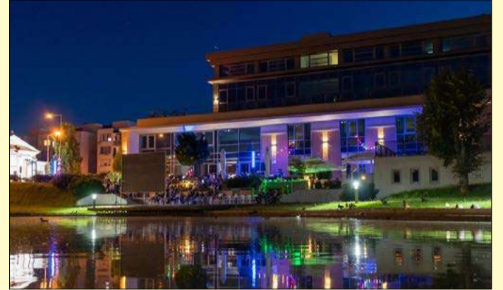
A stégen mozi és koncertek is várják a nézőket

igazgató kiemelte, nagy öröm, hogy három hónap kihagyást követően újra élet költözött a könyvtárba, és korlátozott szolgáltatásokkal újranyithattak. A mostani első kiállításon egyébként a nyomdaipari csomagolóanyagok kaptak más funkciót a BSZC Szent-Györgyi Albert szakgimnáziuma művészeti tagozatosainak jóvoltából.