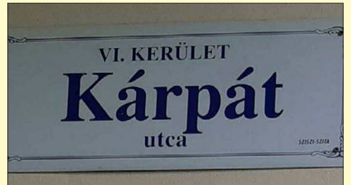
Számos utca őrzi az elcsatolt területek nevét

Egy olyan személyről (Lord Rothermere) is neveztek el közterületet Békéscsabán, aki egy magyarországi látogatás után Angliában, egy napi 1 millió példányban megjelenő újságjában hívta fel a figyelmet a trianoni béke igazságtalanságára. A Rothermere utca ma Batsányi utca.