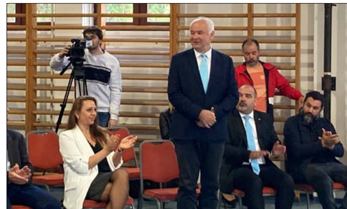
„Szeretnénk ha többen járnának ebbe az iskolába”

A Baptista Szeretetszolgálat nem csupán katasztrófák helyszínein segít, 10 éve immár intézményeket is fenntart országwide – erről Hári Tibor ügyvezető főigazgató beszélt. Hozzátette: több baptista gyülekezet van a megyében, amelyek jó kapcsolatot ápolnak az önkormányzatokkal.