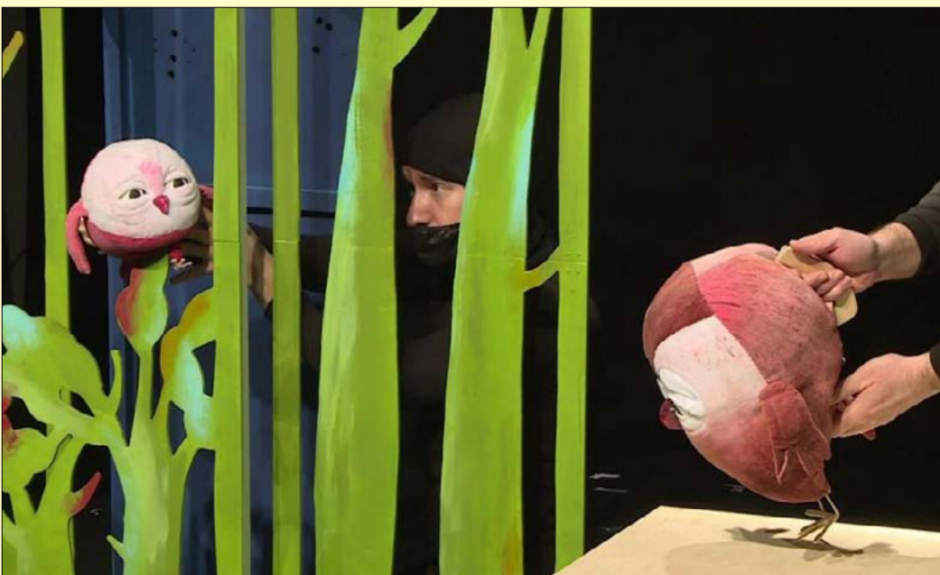
Októbertől lesz látható a bábszínházban A Bagoly, aki félt a sötétben

Idén már szeptemberben minden hétfőn előadásokkal várja a közönséget a bábszínház, amely a Bábozdával nyitotta meg a programok sorát.