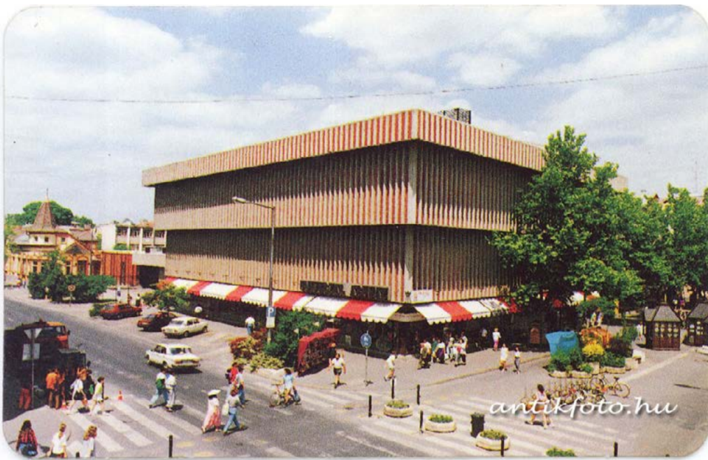
Az egykori Univerzál Áruház épülete és környezete 1994-ben

Régen minden más volt! – halljuk gyakran sokfelől. A Békés Megyei Népújság korabeli számai segítségével nézzük meg, hogy régen tényleg más volt-e minden.