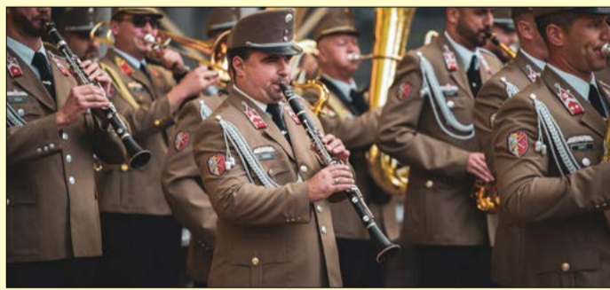
A Hódmezővásárhelyi Helyőrségi Zenekar felvonulása

Az eredeti tervek szerint a Szent István téren a nagyobb fúvószenekarok léptek volna fel, a Stégszínpadon pedig inkább a fiataloknak szóló, brass (rézfúvós) formációk kaptak volna helyet, az esős idő azonban egy kicsit átírta a forgatókönyvet; voltak koncertek a Csabagyöngyében is. A lényeg, hogy minden produkció megtalálta a maga helyét és közönségét.