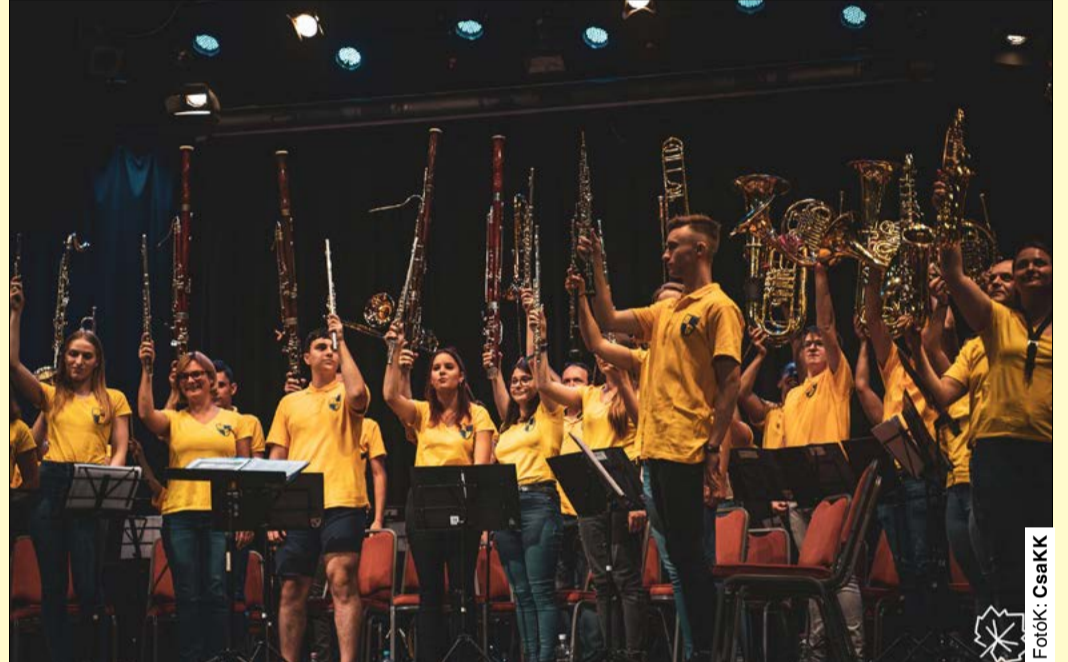
A Körösparti Vasutas Koncert Fúvószenekar a Csabagyöngyében lépett fel

Az érdeklődők a rendezvény három napja alatt több mint tíz produkciót láthattak, köztük természetesen a Körösparti Vasutas Koncert Fúvószenekar előadását is.