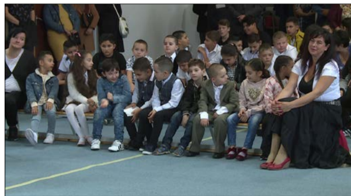
Az iskolában 94 diák kezdte el a 2021/22-es tanévet

Mindenütt nagy várakozással indult az új tanév, annak reményében, hogy folyamatos lehet a jelenléti oktatás. A Szent László utcai iskolába járó tanulók számára változásokat is hozott a szeptember, ugyanis az intézmény fenntartását a Baptista Szeretetszolgálat vette át a Békéscsabai Tankerületi Központtól. Az iskolában már a tanévnyitói is különleges volt, az új diákok verse és a felsősök műsora után a Baptista Szeretetszolgálat jószoigazgatói nagykövete, Mező Misi , a Magna Cum Laude zenekar frontembere játszott el több ismert dalt.