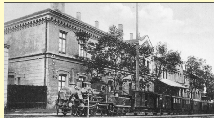
A vasút gőzmozdonyos vonata Csabán, 1890 körül

A vasútvonal tervezése 1862-ben kezdődött, egy év múlva a vasúttársaság engedélyezte az előmunkálatokat. A pályatest földmunkálatainak zömét már 1863-ban elvégezték, utána évekig szünetelt az építés.