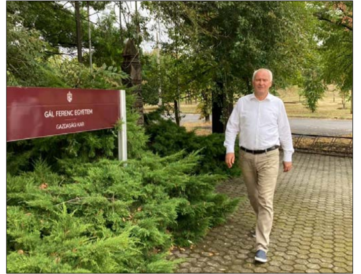
„A Gál Ferenc Egyetem és a Szegedi Tudományegyetem helyben tarthatja a leendő értelmiségieket”

– Ezúttal a megszokotthoz képest egy héttel később, október 4-én indult majd a rendezvény a járványügyi szabályok betartása mellett. Most nem lesz például GarabonCity, mert ott nehéz lenne megteremteni azokat az egészségügyi feltételeket, amelyek szükségesek, és nem lesznek tömegeket vonzó nagykoncertek. Fennáll a veszély, hogy októberben már erősebb lesz a fertőzés kockázata, ezért óvatosságnak kell lenni. Megtartják viszont a diákpolgármester-választást,