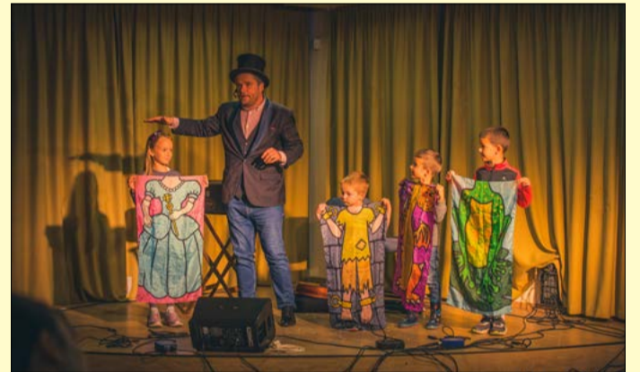
Zenés mese és bűvész műsor várta a gyerekeket