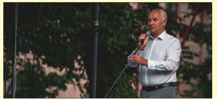
„A ZENIT az ország egyik legrégebbi fúvós eseménye”