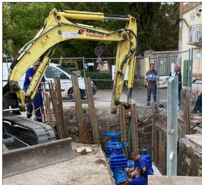
A négyszáz milliméteres fővezeték cseréje

Kérdések és bejelentések, észrevételek a projekttel kapcsolatban e-mailben a bcsvarosfejlesztes@bcsvarosfejlesztes.hu címre, illetve postai úton a Békéscsabai Városfejlesztési Nonprofit Kft., 5600 Békéscsaba, Szent István tér 10., 1. emelet 4. iroda címre küldhetők. (Kérjük, hogy a levélben tett bejelentés esetén ne maradjon el az értesítési cím pontos megjelölése.)