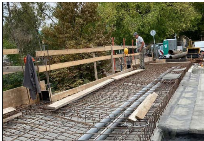
Az új, szélesebb járdakonzol alapozásának előkészítése

A Munkácsy-negyed peremén elhelyezkedő, több mint 100 éves híd már nagyon rossz állapotban volt. Az alatta áthaladó közművezetékek kiváltásai folynak. Az Alföldvíz 400 mm-es fővezetékének kiváltása és cseréje is a kivitelezés része volt. Az Alföldvíz Zrt. elvégezte a tervezett munkálatokat, hogy az októberi fővezetékmosatásra már az új rendszert