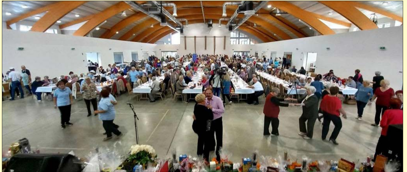
Őszutó Fesztivál a Békés Megyei Nyugdíjas Egyesületek Szövetsége szervezésében, a CsabaParkban