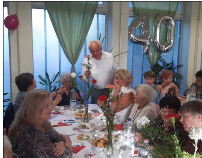
A 40 éves Unicon Nyugdíjasklub ünnepe

– Mivel az 5,5 százalékot ebben az esztendőben meghaladja a gazdaság növekedése, a személyi jövedelemadó visszatérítése az átlagbérre eső adóteher mértékéig már biztosra vehető. Jelenleg a részletek kidolgozása van folyamatban. Mintegy 1,9 millió felnőtt érint majd ez a döntés, azokat, akik gyermeket nevelnek. A házaspárok mellett az élettársaknak és a gyermeküket egyedül nevelőknek is jár ez a visszatérítés, akár munkaviszonyban vannak, akár közfoglalkoztatottak vagy vállalkozók. Körülbelül 750-800 ezer forint lesz a felső határ, és ezt az összeget mindkét szülő megkaphatja. Ideális esetben tehát, jövő februárban, akár 1,6 millió forint visszatérítést is kaphat egy gyermeket nevelő család. Erős szándéka a kormánynak, hogy januártól a minimálbér bruttó 200 ezer forintra nőjön. Ehhez azonban az is szükséges, hogy a mun-