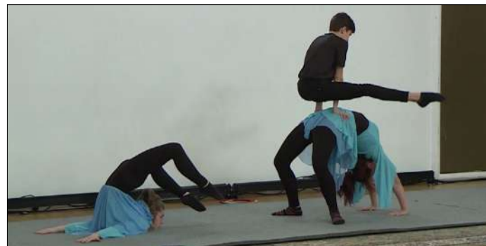
Az érdeklődők elképesztő bemutatót láthattak