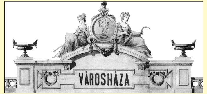
Themis és Ceras allegorikus szobrok a városháza felett (A tervek szerint az eredeti hasonmása visszakérül a helyére)