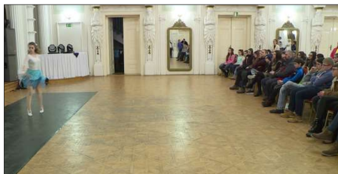
Artista- és táncosképzésre várják a diákokat