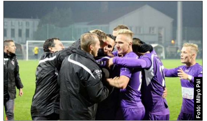
Ebben a szezonban is ilyen pillanatokat szeretnének