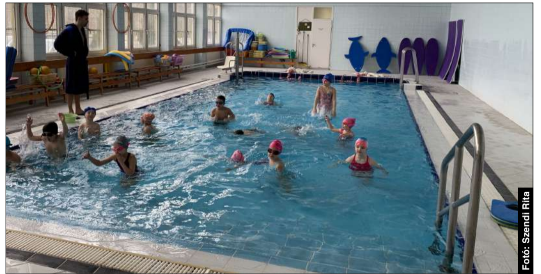
A program keretében a gyerekek tíz alkalommal vehetnek részt úszásktatáson

A sportprogram része például a nagycsoportos óvodások vízhez szoktatása, ami azt jelenti, hogy 6 éves korig 10 alkalommal vehetnek részt a gyerekek úszásktatáson. A Békéscsabai Előre Úszó Klub oktatója, Papp Szilvia elmondta, hogy a tizedik alkalom végére már nagyon sokan elsajátítják a lábtempót, valamint a hátúszás alapjait is.