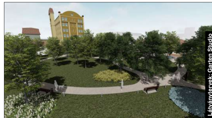
Látványtervek: Garten Studio

A Munkácsy-negyedben levő fákat illetően több szempontot is figyelembe vettek. A tervező hangsúlyozta: fontos szem előtt tartani, hogy a fa kora vagy mérete nem feltétlenül egyenlő az értékével is. Fontos megvizsgálni a fák egészségi állapotát, hiszen lehet, hogy egy idős fa kivül-