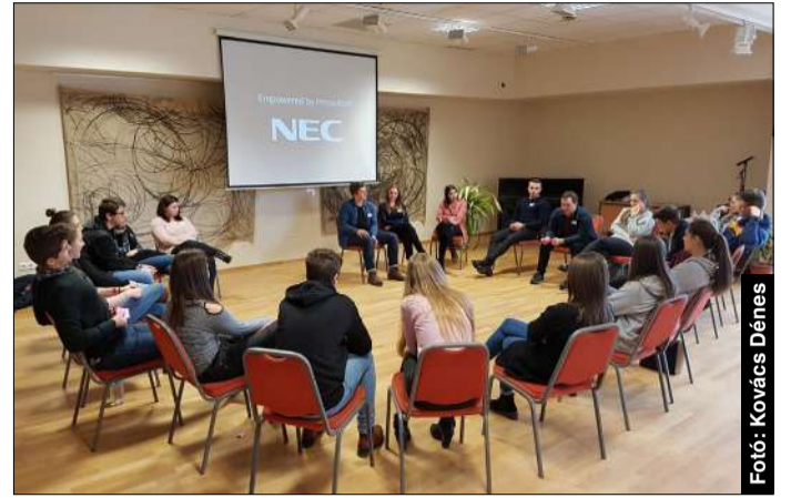
Szó volt a jelentkezésről, kreditekről, de a bulikról is

A főszervező szerint a kérdések évről évre ugyanazok: tényleg nem kell órára járni, vagy hogy hogyan éljem túl a vizsgaidőszakot? De fel kell készülni az aktualitásokból is.